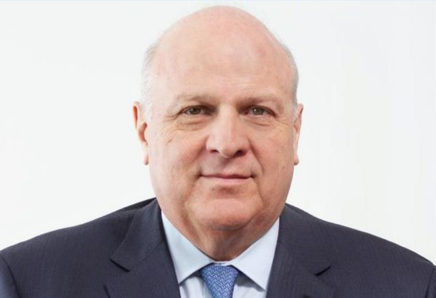
Embajador Antonio José Ardila

Como actor internacional responsable y comprometido, Colombia ve en la Agenda 2030 -compuesta de 17 Objetivos de Desarrollo Sostenible (ODS) y 169 metas orientados al bienestar y la equidad globales- una oportunidad única para generar transformaciones y dar impulso político a temas de interés a nivel internacional, nacional y local, que permitan mejorar la calidad de vida de los conciudadanos. Asimismo, el Gobierno Nacional concibe esta Agenda como una herramienta para generar las condiciones habilitantes de una paz estable y duradera.