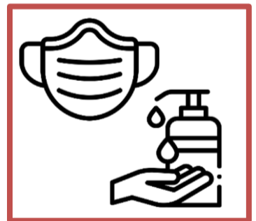
Use sanitary gel and face-mask

5. El oficial de seguridad medirá la temperatura al ingresar al Consulado . En caso de presentar temperatura alta o síntomas relacionados al COVID-19 no podrá ingresar a las instalaciones. Consulte las alternativas para realizar su trámite virtual.