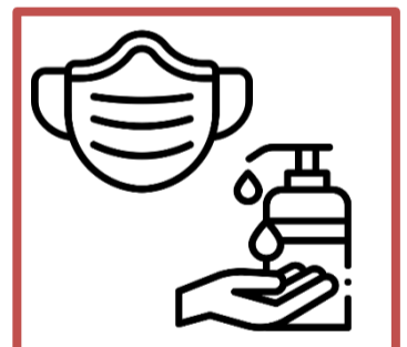
Use sanitary gel and face-mask